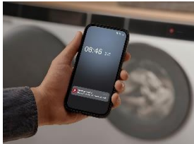
Foto 1: AI Diagnostics bietet Hilfe zur Selbsthilfe, wenn ein Hausgerät einmal eine Störung hat.