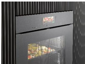
Foto 3: Die Anwendung Smart Food ID erkennt zukünftig noch mehr Speisen und bereitet diese dann automatisch zu. (Foto: Miele)

Foto 2: Mit dem Consumption Dashboard von Miele haben Anwenderinnen und Anwender die Energieverbräuche ihrer Hausgeräte stets im Blick und können Verbräuche über Zeiträume vergleichen. (Foto: Miele)